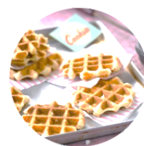
Comité Parents école Drogenbos - FR @comite.parents.ecole.dro genbos

Dans l'école, nous disposons d'un super comité des parents qui sont en charge de différents projets dans l'école. N'hésitez pas à prendre contact avec eux pour embellir encore plus notre si belle école et proposer vos projets. Vous pouvez les retrouver sur Facebook : Comité Parents école Drogenbos – FR